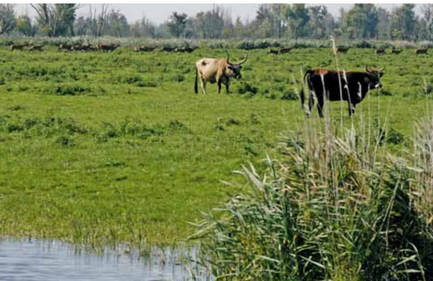
Heckrunderen in de Oostvaardersplassen. De geschrapte verbindingzone OostvaardersWold had deze en andere dieren dichterbij de Veluwe moeten brengen.

de Y moet aansluiten op het Veluwse bos. Het is daar een en al landbouw en menselijke activiteit, en daar is het nu helemaal rood op de kaart.